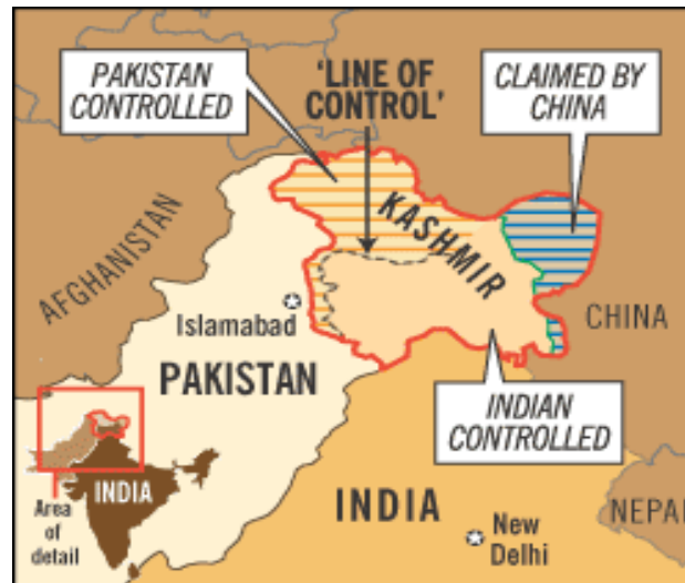
Mapa da Região da Caxemira, apresentando a "Linha de Controle", e a divisão territorial entre China, Índia e Paquistão.

A Caxemira é uma região fronteira entre Índia, Paquistão e China e é palco de conflitos que ocorrem desde a primeira metade do século XX, a partir da independência do subcontinente indiano, em 1947.